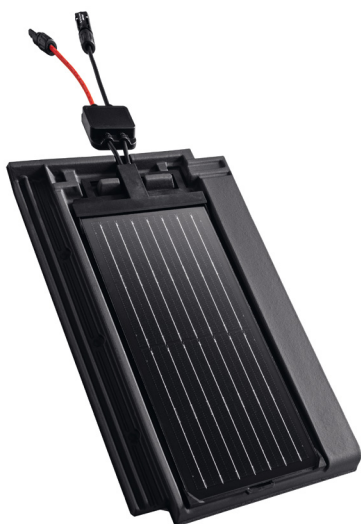
Tuile solaire Panotron PAN 8

La tuile solaire PAN 8 est le fruit de l'union d'une tuile en terre cuite et de la technique photovoltaïque. Un petit module solaire est monté sur chaque tuile afin de produire de l'électricité. Le système est unique au monde, d'une esthétique incomparable, et le montage est d'une simplicité inégalée. La tuile PAN 8 est idéale pour les toitures complexes présentant des obstacles et pour les bâtiments historiques.