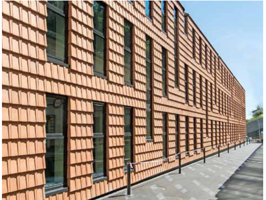
20 000 Tondachziegel kleiden Dach und Fassade des Gebäudes ein.