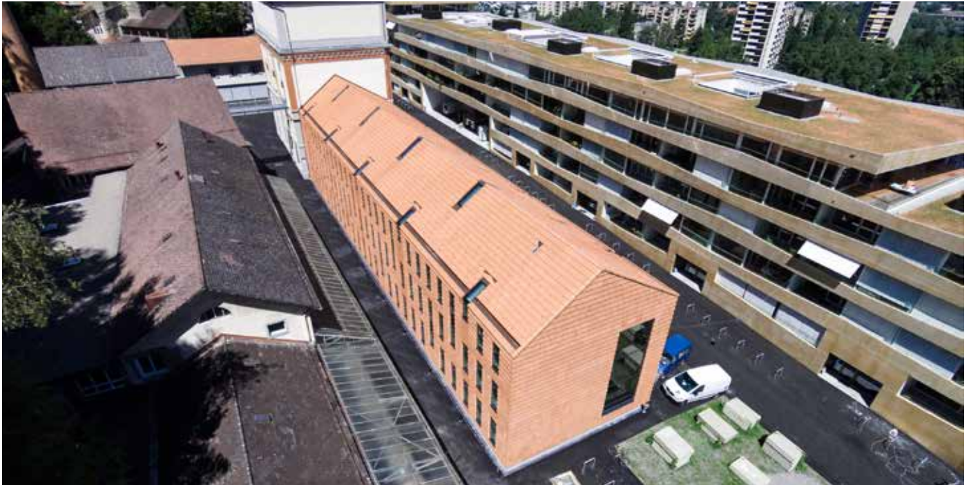
Am Fusse des Gurten treffen Tradition und Moderne aufeinander.