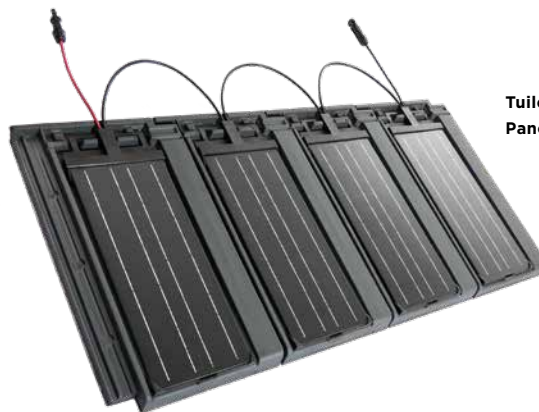
Tuile solaire Panotron PAN