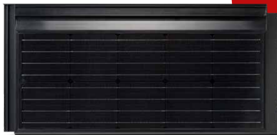
Module solaire Panotron FIT